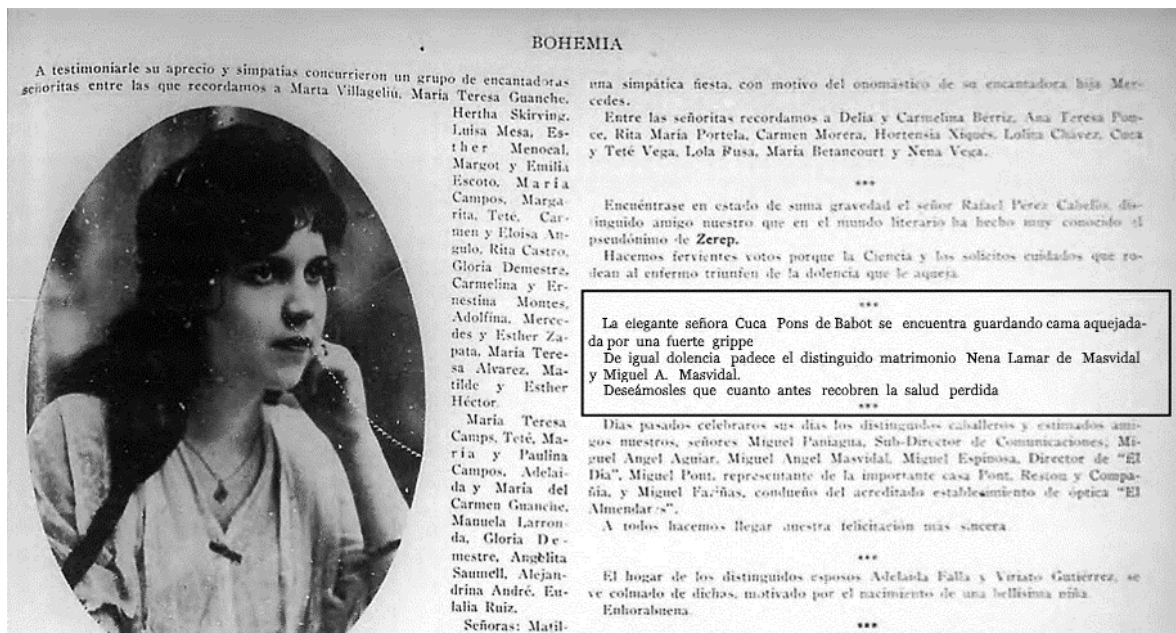
Figura 2. Revista "Bohemia" publicada el 6 de octubre de 1918. Hoja correspondiente a la sección "Sociales" (7)